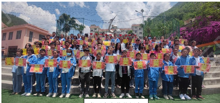
书画大赛获奖师生