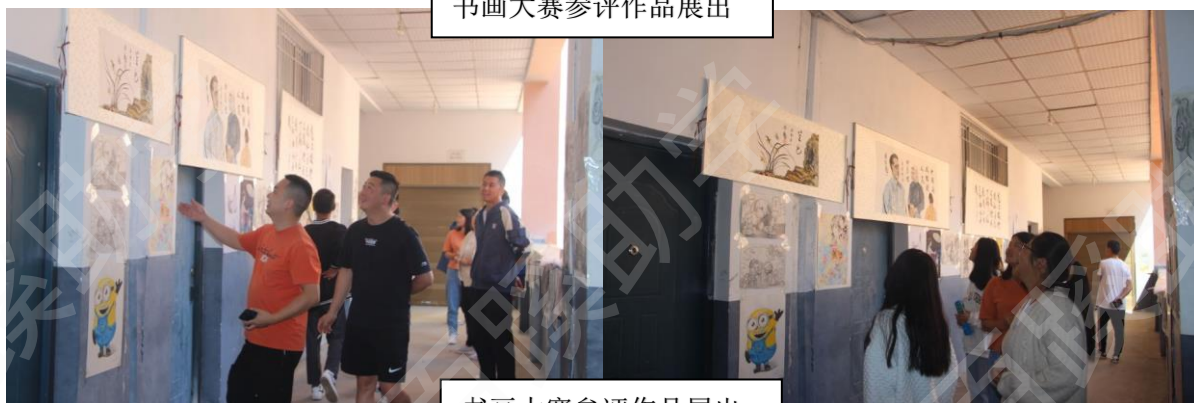
书画大赛参评作品展出