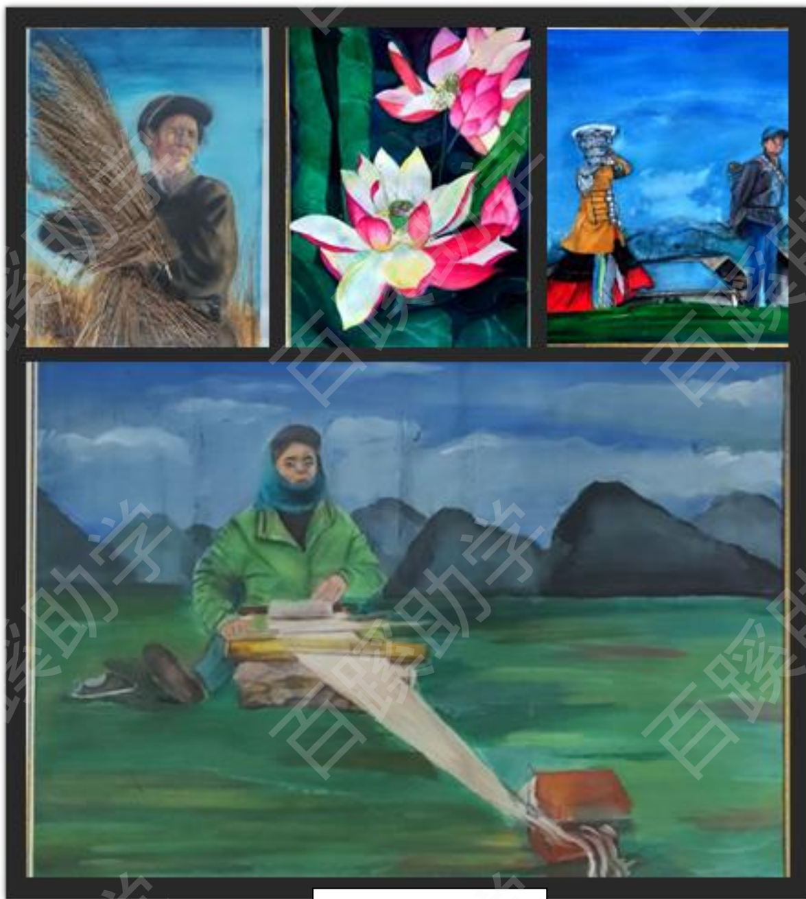
书画大赛参评作品展出

此次书画大赛是交际河中学校园文化节的系列活动之一，旨在提高同学们综合素质和审美情趣，营造良好的校园文化氛围，为爱好艺术的同学提供了一个发挥的平台。