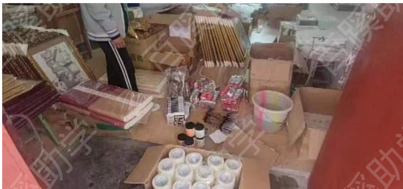
春季增补耗材清单（见下表）：

因项目已与学校自 2021 年秋季学期开始执行合作，课堂开班必备硬件物料基本备齐。但秋季学期课程量大、上课频率较高，学生人数较多，相关课堂学习物料消耗较大，因此春季学期开启前根据学校美术、书法和国画课堂教师提供需求清单，针对性增补相关物料。此次增补耗材全部到校入库并做好登记。