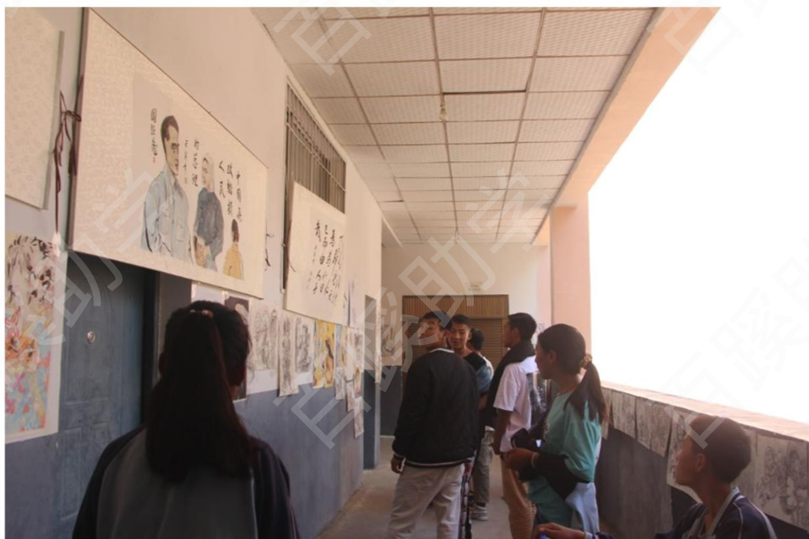
书画大赛参评作品展出