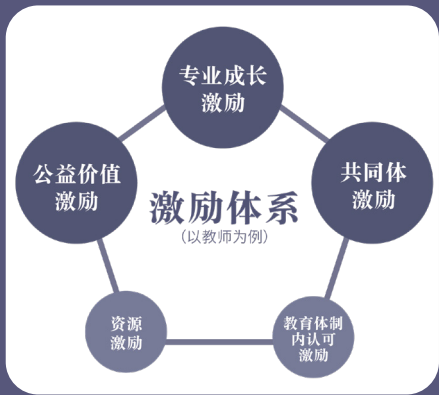
图 5 激励体系（以教师为例）示意图

这三个激励方式只要具备一个便能够激励一部分老师，激励的手段越多带来的效果越好。另外两个配套的激励方式分别为资源激励和教育体制内的认可激励。资源激励是指，给予老师们一些物资或外界资源（例如优质的会议名额、外出参访等），物质性和资源型的激励是比较直接的让老师们能够看到“好处”的方式。体制内的认可激励是指，老师们所做的事情可以得到当地教育部门的认可，还可以为评职称等体制内晋升“添砖加瓦”。配套性的两个激励手段可以作为辅助，但是不能完全占据主导，否则老师们很容易被资源或利益导偏，极端情况下其做出的改变是为了争取自己更大的私利，而真正的内在动机没有被激活，甚至还会出现对于外部资源的“哄抢”或“欺骗”。