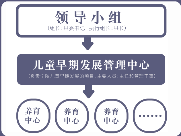
图 3 宁陕模式项目管理体系示意图

政府、县内其他单位共同参与等方式寻找到合适的场地，县政府出资承担场地的硬装改造。湖畔魔豆将逐步撬动政府资金资源配套投入作为县域模式项目可持续发展的重要工作，随着在地服务管理团队的成熟、服务成效和社会认可度的提升，项目成本清晰可控，宁陕县委县政府有了更大的信心和决心，目前已经实现由宁陕县财政承担项目一半的支出，并由在地主要承担持续运营工作。随着本地管理团队的日渐成熟， 湖畔魔豆逐步退居幕后，从陪伴式成长转为必要时提供支持。