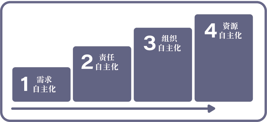
图7 被支持方（B）的四个发展阶段

为了使外部支持者（U）更好地把握被支持者（B）的发展脉络并提供支持，本部分以一家外来社会组织进入县域开展阅读项目为例，详细介绍作为被支持方（B）（下文以教师共同体为例介绍 B 的发展阶段）的四个发展阶段。