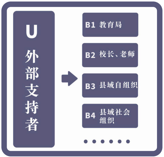
图 2 基于 U+B 理论的支持格局图