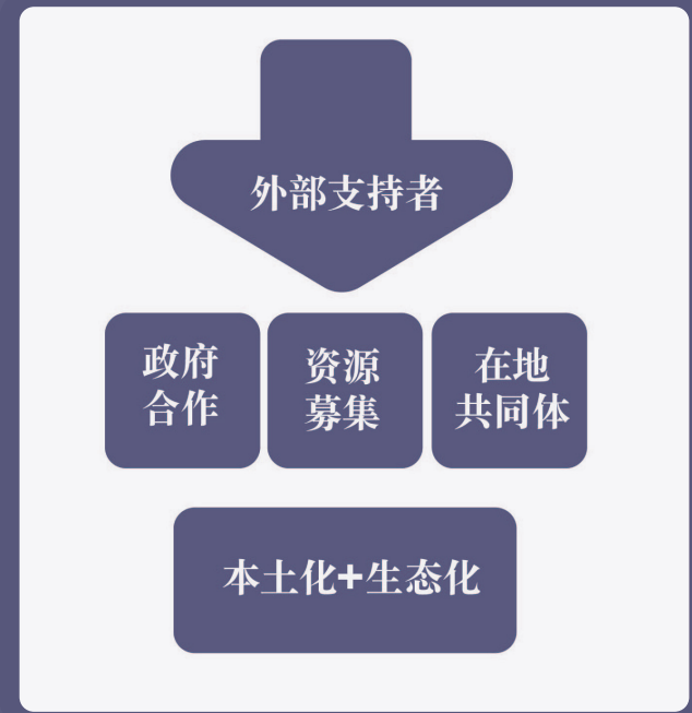
图 1 县域模式的整体格局

在这部分，我们试图整体勾勒出县域模式包含的版块，让大家形成一致化的分析框架进入到具体的行动领域。当然，从不同的项目领域、不同的干预路径出发，对县域模式中包含的版块有着不同的理解，但在这里我们基于对已有组织的调研，试图勾勒出一个整体格局，或许它并不是唯一答案，但涵盖了我们视野范围内的大部分现象。