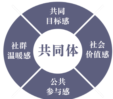
图 6 共同体的构成要素

如右图 6 所示，共同体包含了四个要素，分别为社群温暖感、共同目标感、社会价值感、公共参与感。一个共同体的形成不一定需要四个要素全部达到，当有部分满足时也能够建立起共同体，但这只是共同体的初级阶段，当共同体逐渐向着理想目标发展，就需要兼顾或包含这四个要素。