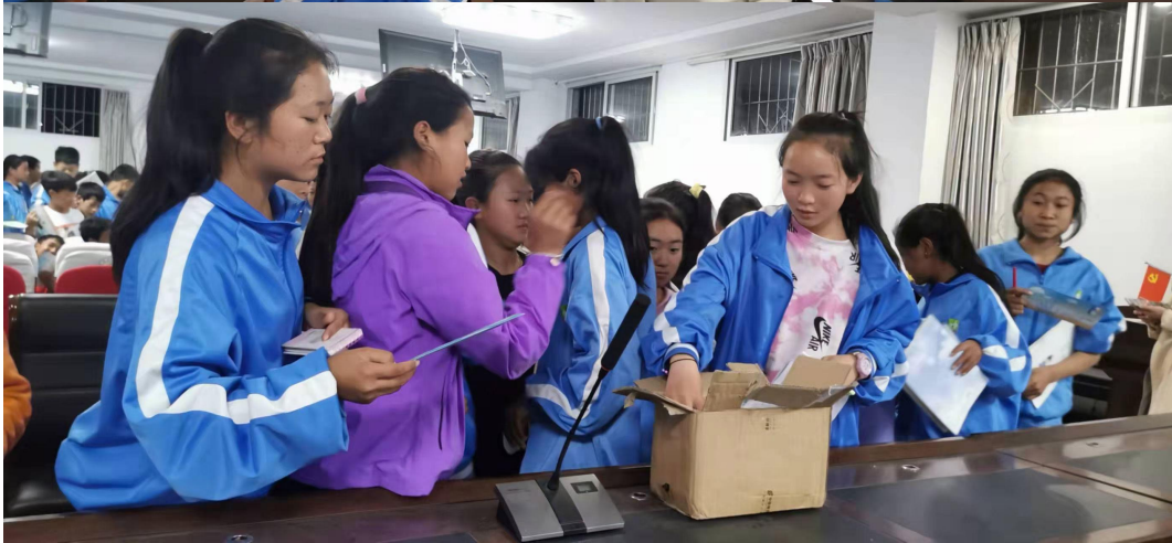
通信孩子家庭情况