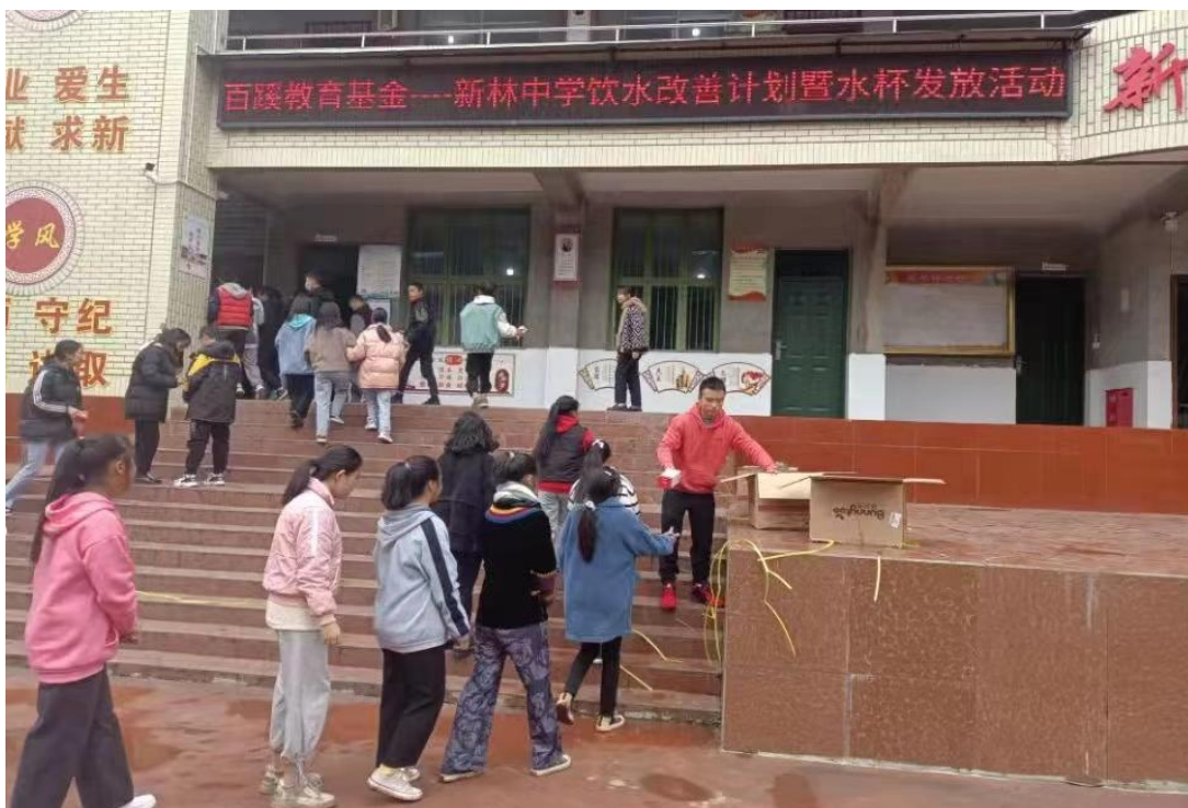
图 2 学校为学生发送饮水杯