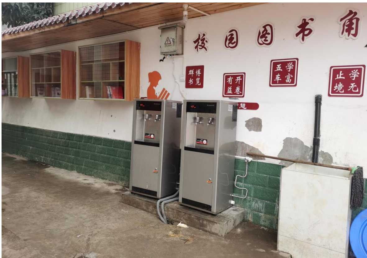
图 1 两台开水器安装完毕