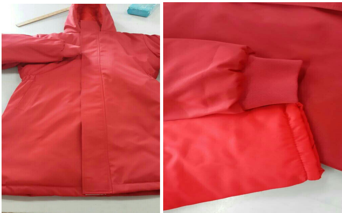
左图为今年的款式 - 深红色女款。右图为女款袖口对比，颜色对比。