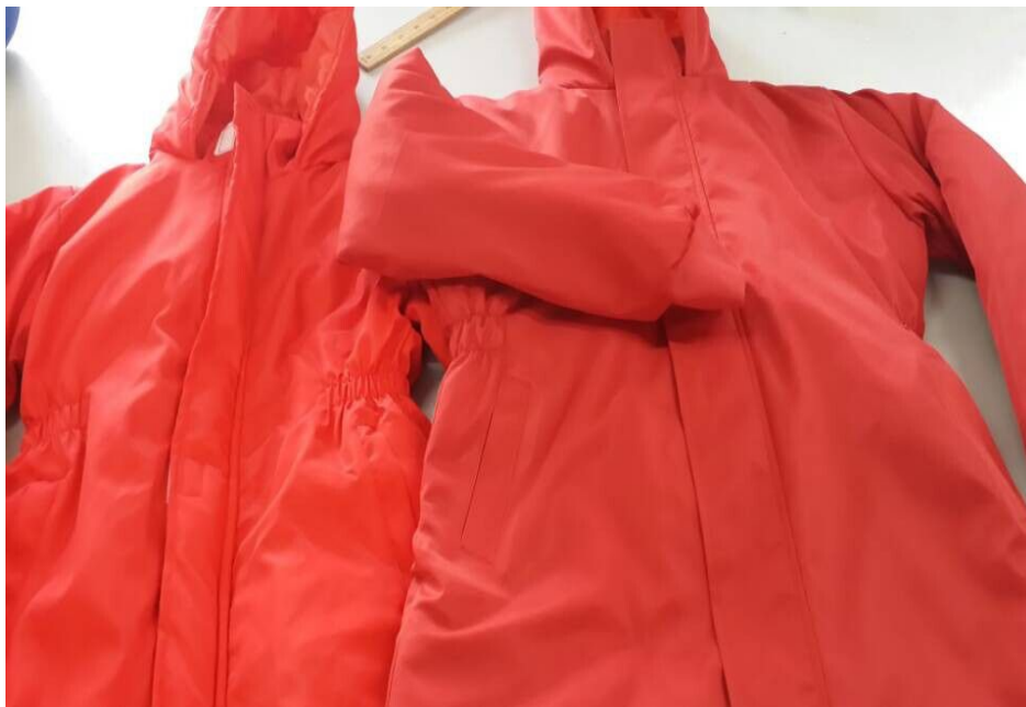
女款-左边是去年的款式，右边是今年做的样衣