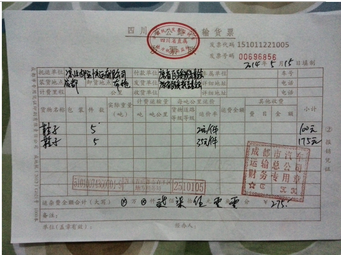
图三：鞋子物流发票