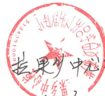
图二：拉果乡中心校收条