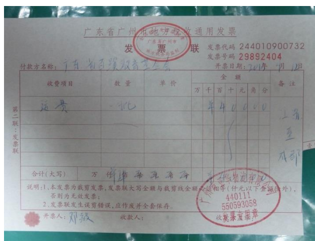
图3 南通至成都物流费用 (400 元)