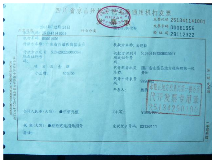
图4 成都至布拖物流费用 (500 元)