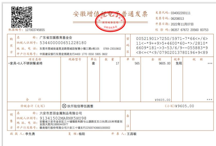
图 2 餐桌椅发票二, 金额 9605 元