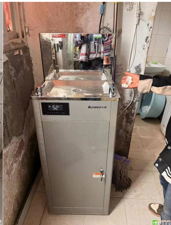
图 7- 图 12 联补小学收条和反馈照片