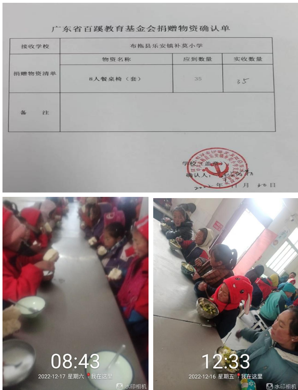
图 13- 图 15 补莫小学收条和反馈照片