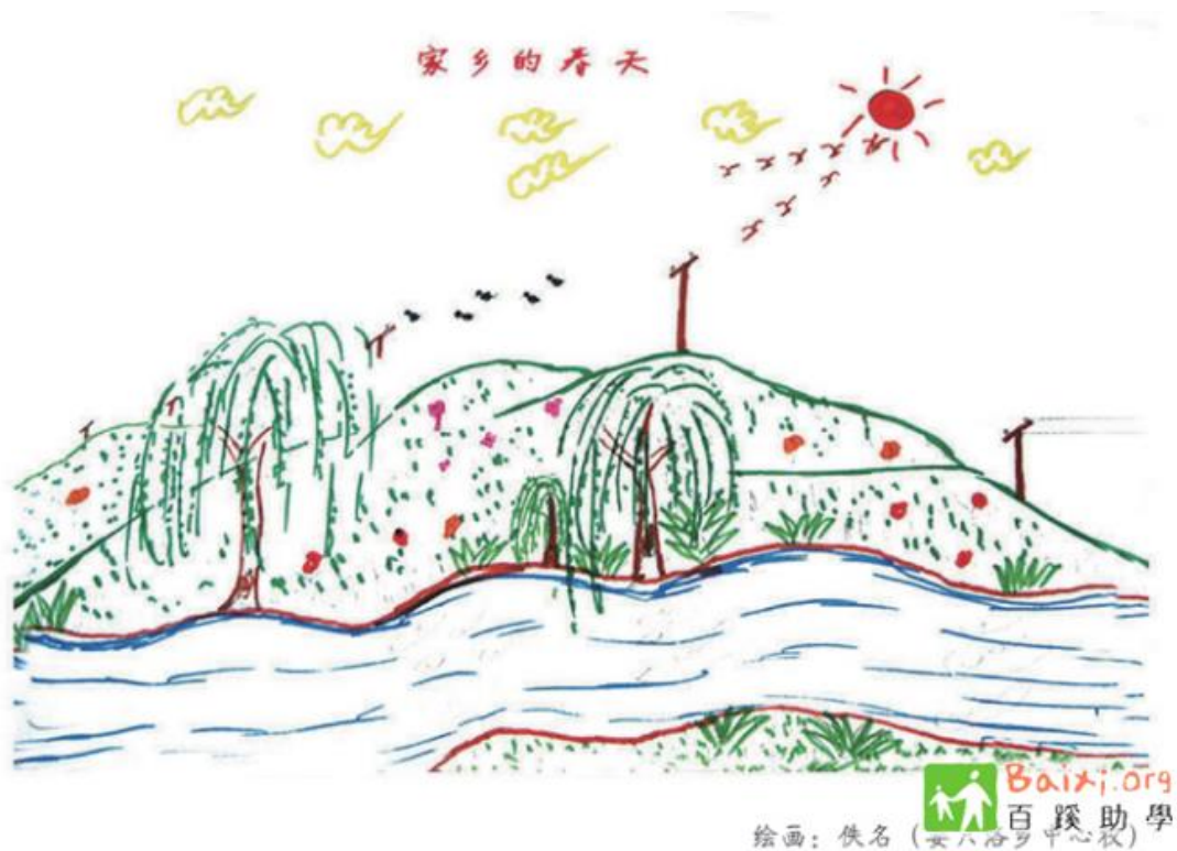
孩子们眼中的家乡的春天

和城市里孩子们的画作一样，这些作品向我们展示了画作背后的山区小朋友的故事和生活。